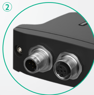
② 2x M12 5-pol (male/female)