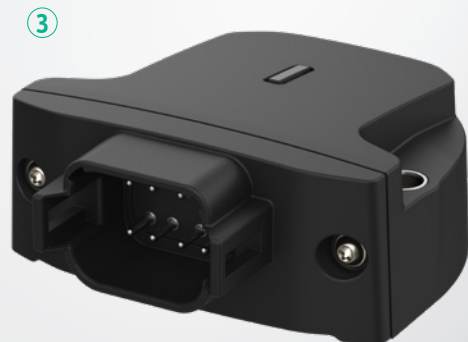
③ Deutsch DT04-08PA